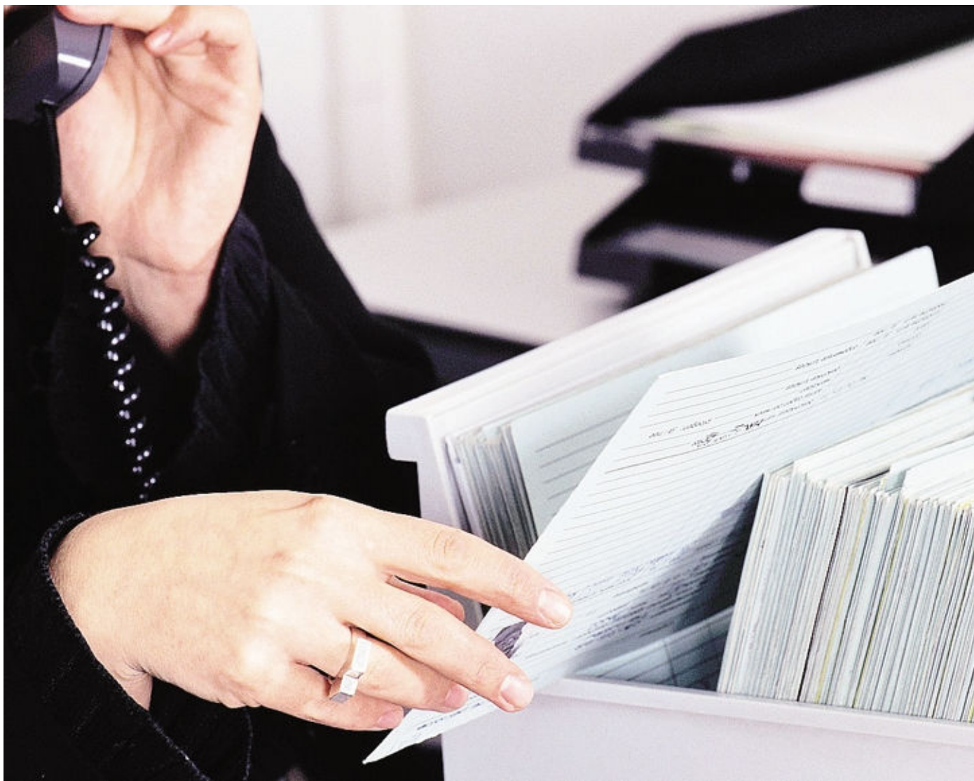
L'autunno porta con sé novità e scadenze sul fronte fiscale e burocratico: i professionisti di «Trovarisposte» rispondono ai quesiti dei lettori

Per i notai novità dal decreto Sblocca Italia. I commercialisti alle prese con l'incognita Tasi. I progetti dei consulenti del lavoro